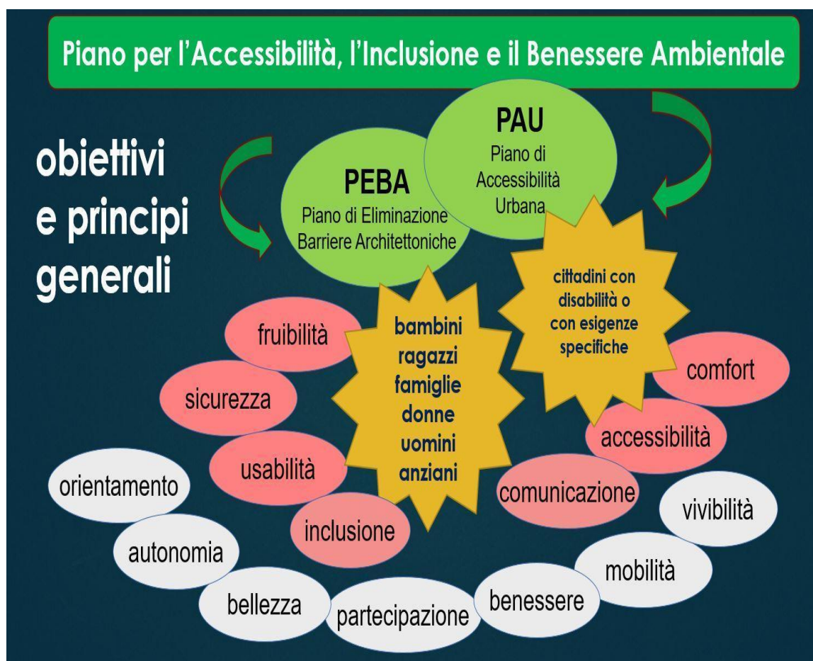
Fig. 1 – Obiettivi e principi